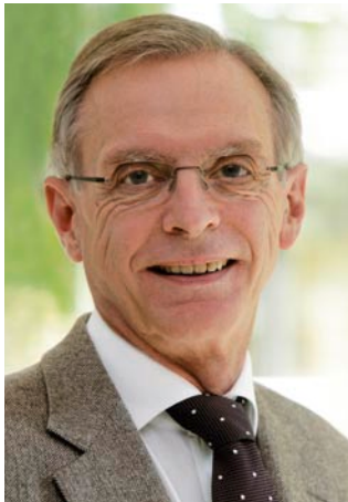
Dr. med. Wolfgang Panter Präsident des VDBW

die Diskussion, welche Leistungen nur durch Ärztinnen und Ärzte selbst erbracht werden können und welche delegierbar sind, ist weiterhin in vollem Gange. Auch in der betriebsärztlichen Betreuung diskutieren wir intensiv darüber, was aus fachlichen Gründen zwingend als ärztliche Aufgabe anzusehen ist und für welche Tätigkeiten unter definierten Voraussetzungen eine Delegation an nichtärztliches Assistenzpersonal möglich ist. Einen ersten Diskussionsentwurf haben wir mit dem VDBW-Sonderheft im Dezember 2011 vorgelegt und ausdrücklich um Ihre Rückmeldung gebeten. Die sich daraus ergebenden Änderungen haben wir aufgenommen und in der jetzigen überarbeiteten Ausgabe des Sonderheftes berücksichtigt. Vor allem das Thema Impfen hat die Kollegenschaft beschäftigt. Auch der Ausschuss Arbeitsmedizin der Bundesärztekammer hat sich mit dieser Frage nochmals intensiv auseinandergesetzt. Impfen bleibt eine nicht delegierbare Leistung und zwar deshalb, weil zum Impfen eben nicht nur die subcutane oder intramuskuläre Injektion, sondern auch die Anamnese und die Aufklärung gehört. Diese wichtigen Bestandteile des Gesamtvorgangs „Impfen“ sind in allen Fachgebieten dem Arzt vorbehalten, so dass allenfalls die Injektion an nichtärztliches Personal delegierbar ist. In vielen betriebsärztlichen Bereichen ist es nicht sinnvoll, die einzelnen Tätigkeiten im Zusammenhang mit dem Impfen zu splitten und durch verschiedene Personen zu erbringen.