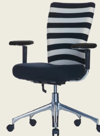
T-Chair Antonio Citterio